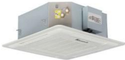
فن کویل کاستی چهار طرفه