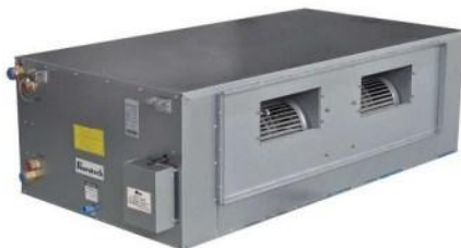
فن کویل کانالی