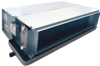
فن کویل سقفی توکار