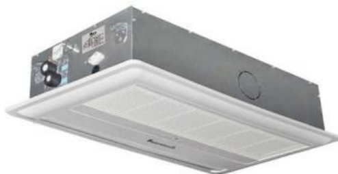
فن کویل کاستی یک طرفه